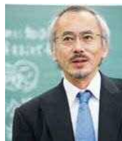
撮影 足田 千里

「夜回り先生、なんでドラッグを使ってはいけないんですか？」(東山書房)、「さらば、哀しみのドラッグ」(高文研)、「夜回り先生 子育てで一番大切なこと」(海竜社)ほか多数。